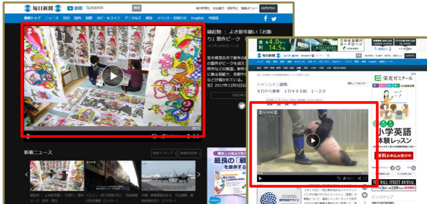
「毎日動画」( http://mainichi.jp/movie/ )